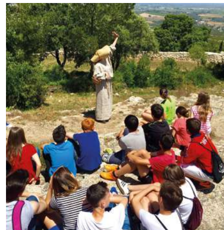
Una ciutat medieval entre dos mons MAC Olèrdola