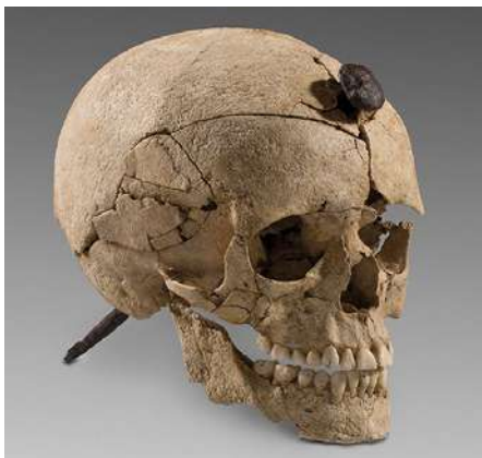
En què creien els ibers? MAC Ullastret