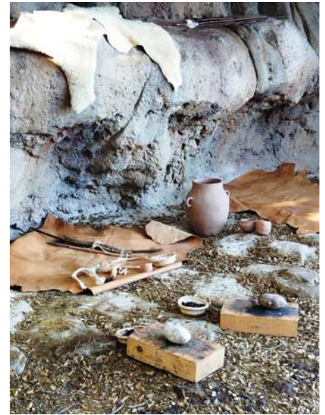
Màgia dins les coves MAC Olèrdola