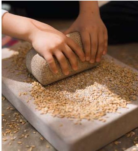
Arribar i moldre MAC Ullastret