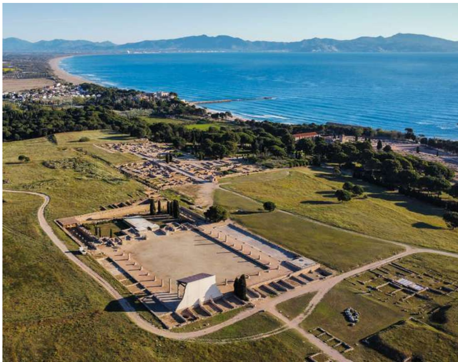
Empúries. Ciutat romana MAC Barcelona