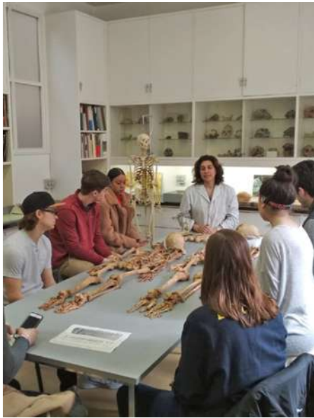
CSI Ossos: paleoantropologia forense- MAC Barcelona