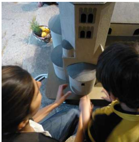
Els sons de Galligants MAC Girona