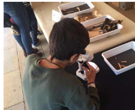
El laboratori d'arqueologia MAC Girona