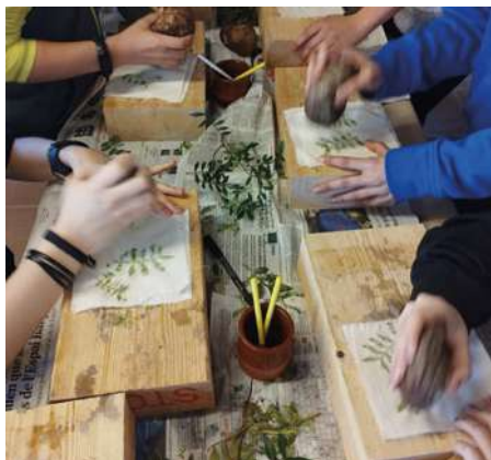
Els colors dels ibers MAC Olèrdola