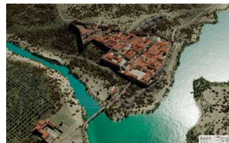
Descobrint la Gerunda romana MAC Girona