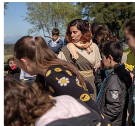
Coneix Ullastret amb la Nisunin MAC Ullastret