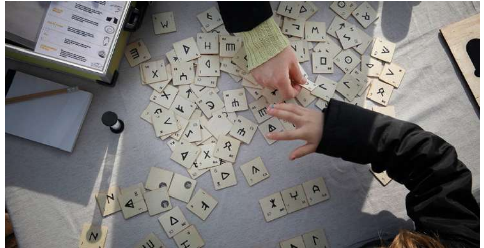
Sopa de lletres MAC Ullastret