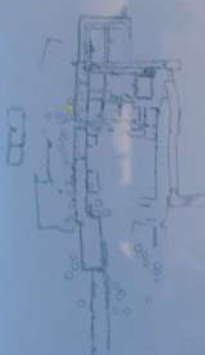
Plànol de l'estructura nord del poblat del Puig de Sant Andreu amb la ubicació de la sala on s'ha trobat el crani

Una singular cultura mediterrània Els ibers