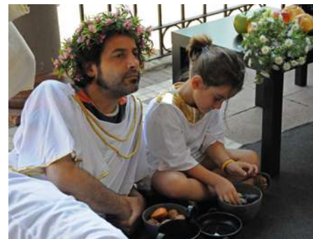
Déus, herois i mites MAC Barcelona