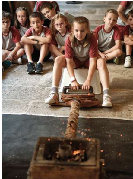
Les innovacions a la prehistòria MAC Girona